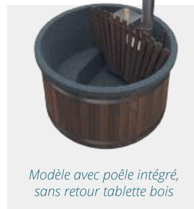
Modèle avec poêle intégré, sans retour tablette bois