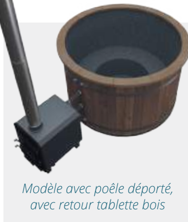
Modèle avec poêle déporté, avec retour tablette bois

Les bains nordiques Aquilus existent en 2 dimensions de cuve (160 cm ou 180 cm), 2 systèmes de chauffage de l'eau (poêle intégré ou poêle déporté 45 kw) et la cuve se personnalise, grâce à la tablette bois périmétrique.